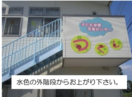
水色の外階段からお上がり下さい。