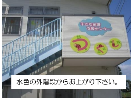
水色の外階段からお上がり下さい。