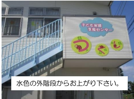
水色の外階段からお上がり下さい。