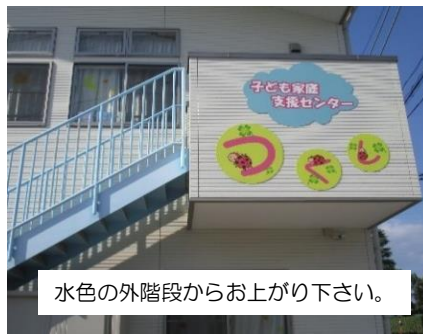
水色の外階段からお上がり下さい。