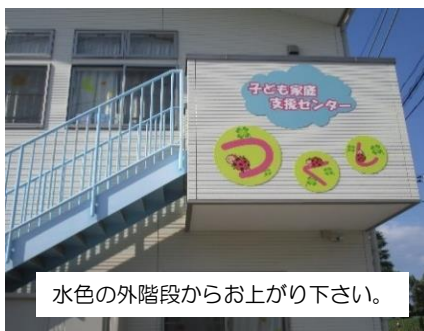
水色の外階段からお上がり下さい。