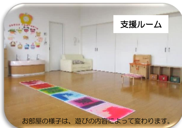
お部屋の様子は、遊びの内容によって変わります。